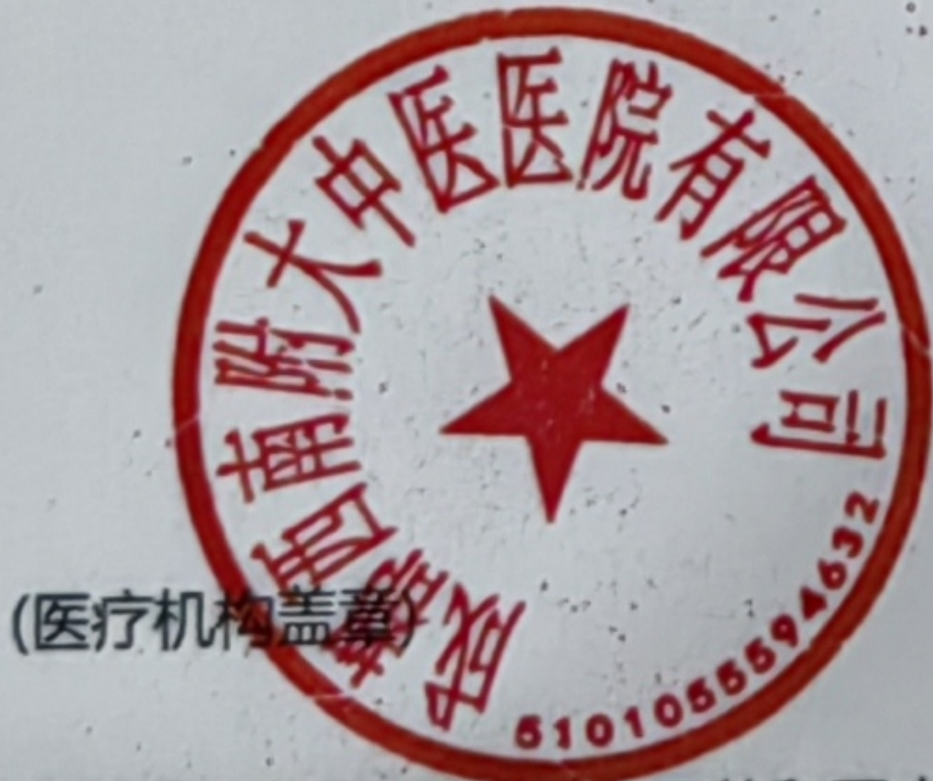
图 (2) 印刷品