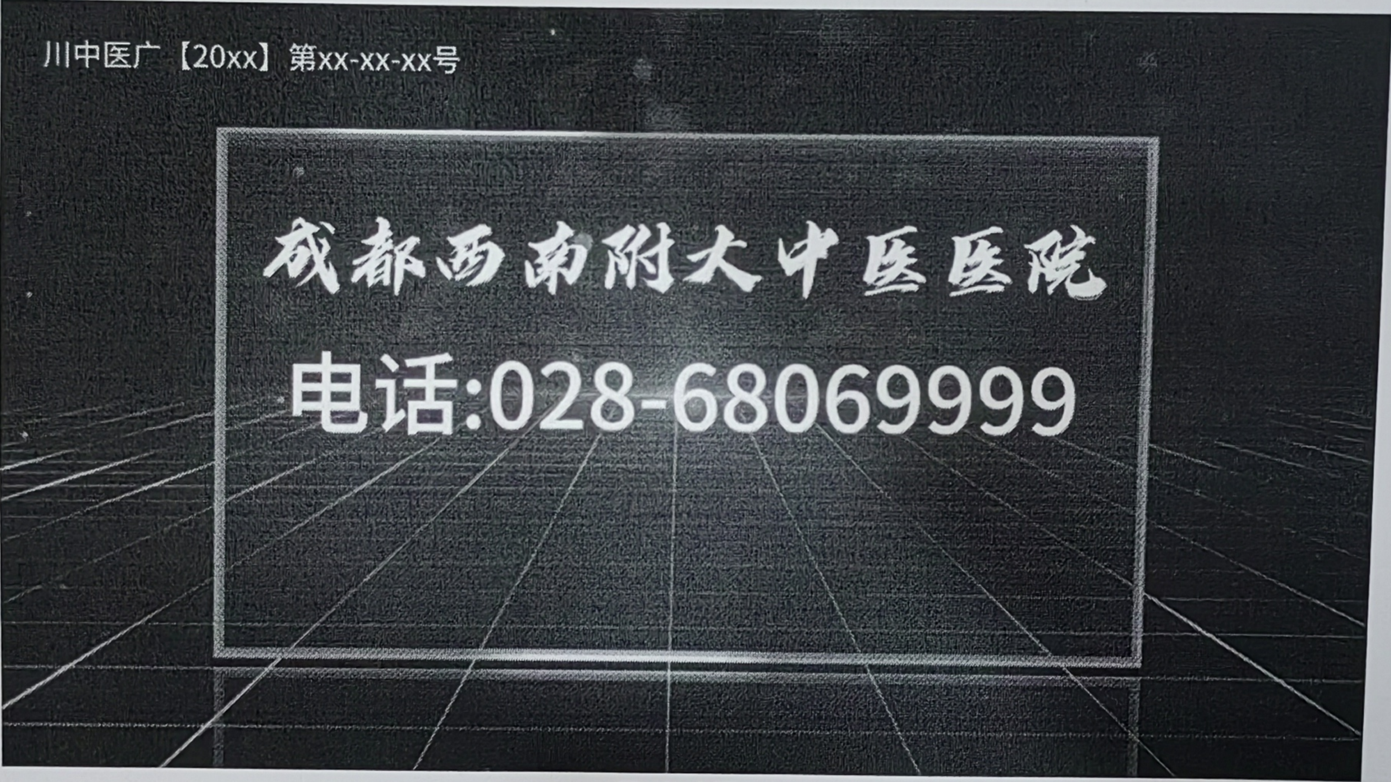
图 (6) 广播